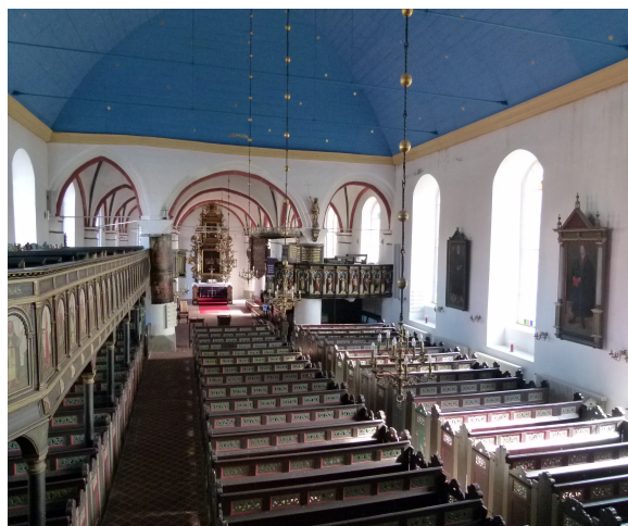
Männerlektor hier links

nach einem Kaufeintrag 1598 erbaut in Korrespondenz zum Fürstenlektor – die Männer des Kirchspiels auf einer Höhe mit dem Herzog. Unter dieser Galerie entstand der sogenannte „Unterstand“.